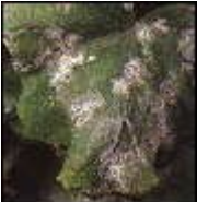
Echter Mehltau auf Blattoberseite