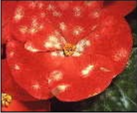
Echter Mehltau auf Blüte