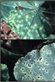
Pelargonienrost oben: Blattoberseite unten: Blattunterseite

Die als Rost bezeichnete Krankheit an Pflanzen wird durch verschiedene Rostpilze hervorgerufen. Der Befall äußert sich durch die blattunterseits vorzufindenden, warzenähnlichen Sporenlager, welche die namensgebenden, staubförmigen und rostfarbenen Sporen enthalten. An den befallenen Stellen ist die Blattoberseite meist aufgehell. Das befallene Blatt stirbt rasch ab und die Sporen können die Wirtspflanze weiter infizieren und so erheblich schädigen.